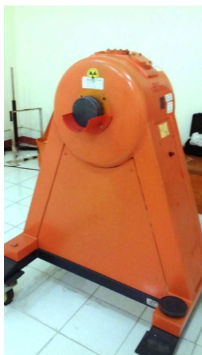
Gambar 3. Fasilitas kalibrasi gamma Cs-137 OB-85 di PTKMR – BATAN

Gambar 3 memperlihatkan fasilitas kalibrasi Cs-137 OB-85 di PTKMR – BATAN, sedangkan Gambar 4 memperlihatkan cara peletakan dosimeter OSL pada penyinaran dosis H*(10) di fasilitas kalibrasi Cs-137 OB-85.