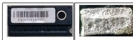
Gambar 2. Contoh dosimeter OSL tipe EX yang belum dibungkus aluminium foil (kiri) dan sudah dibungkus (kanan).

Disiapkan dosimeter OSL tipe EX sebanyak 16 buah yang dibagi menjadi 4 grup yaitu Grup Kontrol, Grup 1, Grup 2 dan Grup 3 yang masing-masing grup terdapat 4 buah dosimeter. Semua dosimeter di- annealing dan dibaca dengan OSLD Reader serta dipastikan bahwa hasil pembacaan 0. Dosimeter OSL yang sudah di- annealing kemudian dibungkus dengan kertas aluminium foil untuk mencegah cahaya tembus dan dimasukkan ke dalam plastik ber- seal . Masing-masing plastik diberi tanda grup dan nomor a, b, c, dan d. Dosimeter OSL sudah siap disinari. Gambar 2 memperlihatkan contoh dosimeter OSL tipe EX.