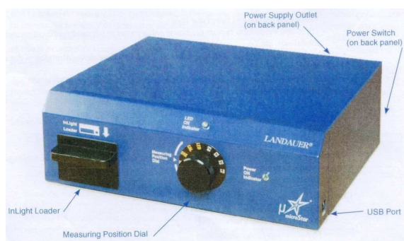
Gambar 1. OSLD microStar Reader

MicroStar Reader adalah jenis InLight reader yang terkecil dan dapat digunakan untuk melakukan pembacaan dosis di lapangan ( in situ ) dalam rangka melakukan evaluasi dosis secara cepat dan akurat. InLight system merupakan sistem perhitungan dosis secara otomatis menggunakan teknologi OSL yang dikembangkan oleh Landauer. Gambar 1 memperlihatkan perangkat OSLD microStar Reader.