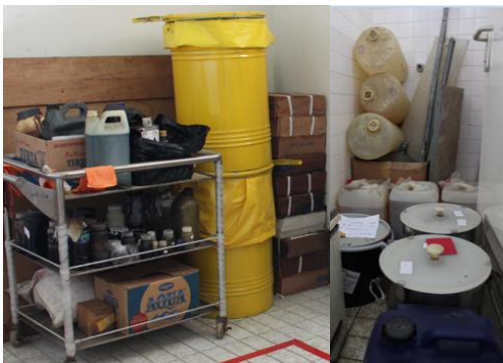
Gambar 2. Ruang Penyimpanan Limbah B3 Sementara (CR 19 - IEBE).

Secara perlahan terjadi kenaikan jumlah limbah B3 sebesar 250 % (2,5 kali) dibandingkan dengan tahun 2009 dari 43,8 liter menjadi 109,5 liter pada tahun 2010 (lihat Gambar 1 dan Tabel 2).