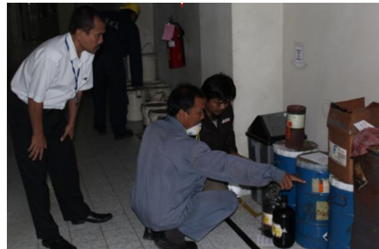
Gambar 3. Pemeriksaan Label Kemasan Limbah B3 oleh staf PTLR.