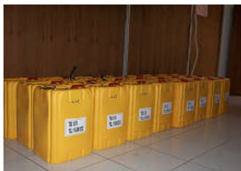
Gambar 1. Kondisi penyimpanan jerigen berisi saus sambal pada suhu ruang

Jerigen PE dibuat dua lapis, partikel nano \text{TiO}_2 ditambahkan pada lapisan bagian dalam. Lapisan tersebut kurang lebih 30 % berat dari total bahan untuk membuat satu jerigen. Konsentrasi \text{TiO}_2 yang digunakan adalah 0 %; 0,05 %; 0,1 % dan 0,15 %. Jerigen PE yang sudah ditambah partikel nano \text{TiO}_2 kemudian diisi dengan produk olahan berupa saus sambal komersial yang ada di pasaran. Jerigen dibuat di salah satu industri kemasan yang terletak Serang, Banten. Untuk satu variabel, jerigen yang dibuat berjumlah 56 buah dengan kapasitas 20 L.