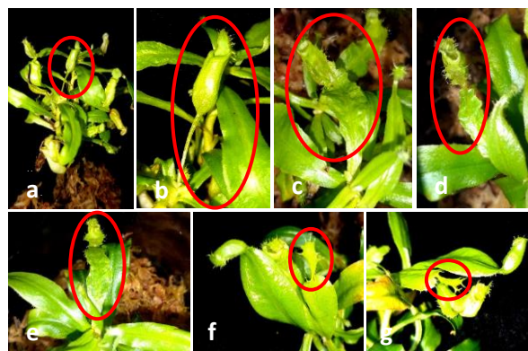
Gambar 4. Variasi pada N. ampullaria pada dosis 15 Gy setelah perlakuan iradiasi pada minggu ke-12: a-b. terbentuknya kantong di ujung bagian tulang daun, c-e. daun dan kantong menjadi keriting, f-g. pada ujung daun hanya terbentuk bagian tutup / lid kantong

perubahan fenotip yang dapat dilihat dengan adanya perubahan pada morfologi tanaman. Perubahan fenotip tersebut bisa mengarah pada perubahan positif seperti bentuk bunga, daun, dan warna bunga maupun perubahan - sehingga menghasilkan keragaman tanaman yang unik. Dosis iradiasi gamma yang tinggi menyebabkan proses fisiologis tanaman terganggu sehingga terjadi rusaknya sel meristem. Hal ini menyebabkan tanaman yang diiradiasi menghasilkan keragaman yang unik karena mutasi bersifat acak [23]. Perlakuan iradiasi gamma menyebabkan perubahan warna, corak, dan bentuk tepi petal bunga pada anyelir [24]. Selain itu, iradiasi gamma menghasilkan keragaman fenotipik pada dua varietas krisan in vitro . Dosis iradiasi gamma 20 Gy meningkatkan keragaman bentuk, ukuran dan warna daun krisan. Mutan yang dihasilkan pada penelitian ini yaitu daun kecil dan tidak bergerigi, perubahan warna batang menjadi kemerahan, kerdil, membentuk roset, dan menghasilkan daun variegata [12].