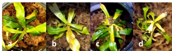
Gambar 3. Bagian pucuk yang mati, menguning atau mencoklat pada dosis a. 30 Gy b. 45 Gy c. 60 Gy d. 90 Gy pada minggu ke-12 setelah perlakuan

Perubahan warna akibat perlakuan dosis iradiasi juga terjadi pada penelitian mutasi induksi. Pada jeruk keprok garut yang menggunakan eksplan kalus. Hasil penelitian tersebut menyebutkan peningkatan dosis iradiasi menyebabkan kerusakan fisiologis pada kalus seperti terjadinya perubahan warna kalus dari putih menjadi kecoklatan dan terhambatnya pembelahan sel dan proliferasi sel. Perubahan warna dan terhambatnya proliferasi sel menunjukkan tingkat sensitivitas tanaman terhadap dosis iradiasi gamma yang diberikan [22].