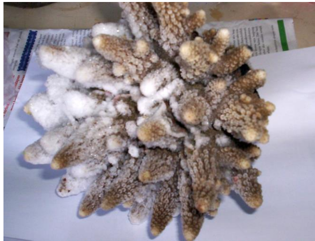
Gambar 1. Koran setelah dimasukkan kedalam Freezer