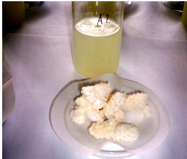
Gambar 3. Kerangka koral dan filtrat mengandung jaringan koral setelah proses oksidasi dan sonikasi.

Resolusi (FWHM) sistem spektrometri gamma yang digunakan adalah 1,89 keV pada energi 60 Co 1332 keV. Nilai ini cukup memenuhi syarat untuk pelaksanaan pengukuran/pencacahan dalam penelitian ini. Kalibrasi energi menggunakan spektrum standar 152 Eu yang mempunyai rentang energi gamma 121,78 keV – 1408,08 keV (Gambar 4).