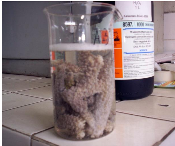
Gambar 2. Proses oksidasi koral ke dalam larutan 10% H 2 O 2