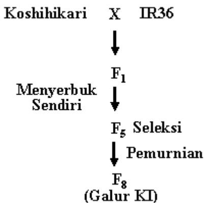
Gambar 1. Skema pemuliaan galur KI.

KI 237 adalah galur berpenampilan bagus dengan potensi hasil tinggi, tetapi batang tanaman terlalu tinggi yaitu mencapai lebih dari 110 cm, akibatnya tanaman tersebut mudah rebah. Untuk mereduksi tinggi tanaman galur KI 237, sebanyak 50 gram benih dari galur tersebut diiradiasi dengan sinar gamma dosis 200 Gy. Sebanyak 500 tanaman M_1 dipanen secara individu untuk mendapatkan benih M_2 , dan masing-masing M_2 ditanam sebanyak 20 tanaman. Seleksi terhadap tinggi tanaman dilakukan pada 342 galur M_2 .