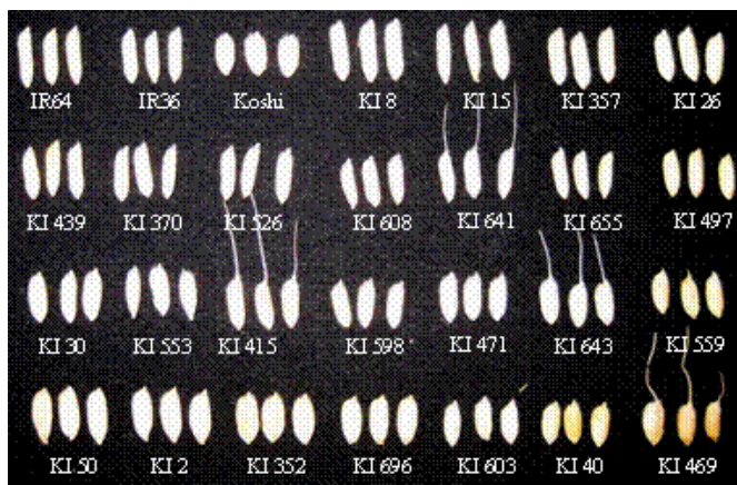
Gambar 4. Variasi gabah galur KI.

Pada program pemuliaan selanjutnya, galur-galur yang berpenampilan bagus sebanyak 7 galur langsung masuk pada uji daya hasil. Dari galur-galur yang masih banyak kekurangannya, dipilih sebanyak 23 galur, diperbaiki melalui persilangan antar sesama galur terpilih untuk mengumpulkan sebanyak mungkin sifat-sifat yang diinginkan pada satu tanaman. Dua galur yaitu galur KI 237 dan KI 432, secara umum sudah bagus tetapi masih memiliki sedikit sifat yang tidak diinginkan, diperbaiki melalui mutasi induksi dengan menggunakan iradiasi sinar gamma.