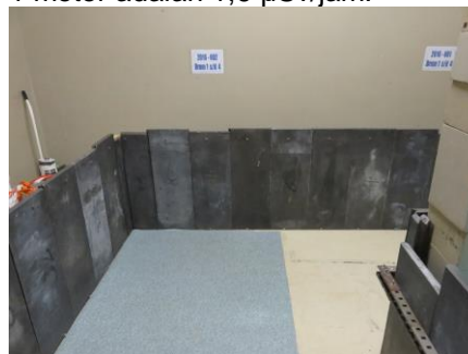
Gambar 3. Wadah batu topaz pasca iradiasi didalam ruang penyimpanan

radiasi yaitu 10 \mu\text{Sv}/\text{jam} . Pengukuran paparan radiasi pada permukaan pintu luar ruang adalah 4,0 \mu\text{Sv}/\text{jam} dan jarak 1 meter adalah 1,6 \mu\text{Sv}/\text{jam} . (10)