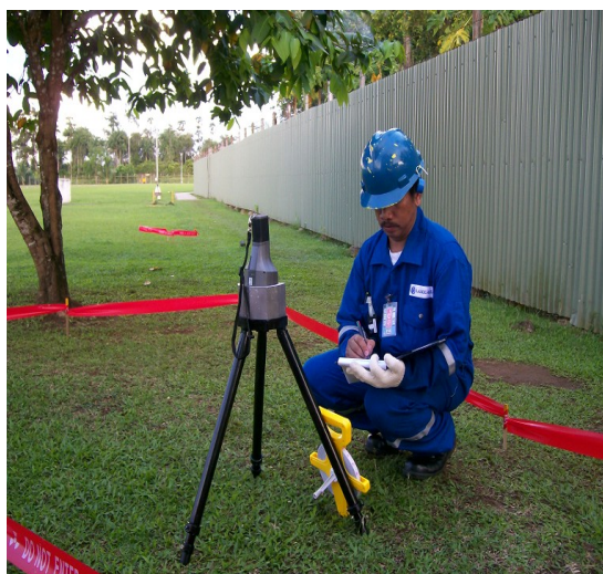
Gambar 2. Pengukuran ketebalan tanah terkontaminasi NORM dengan identifinder