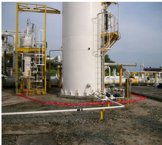
Gambar 1. Patok dan penandaan area dengan laju dosis lebih dari 50 \mu\text{R}/\text{jam}

limbah TENORM dan nilai konsentrasi/aktivitasnya; 3) Pengepakan atau pewadahan yang memadai harus dilakukan untuk menghindari terjadinya kebocoran atau bahkan pecah dalam transportasi.