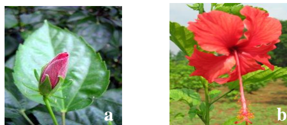
Gambar 2. Penampilan daun, putik (a) dan bunga tanaman kontrol (b)

Menurut Jain et al [22], pemuliaan tanaman hias sebagian besar tujuannya adalah untuk mengembangkan tanaman dengan bentuk bunga dan tipe percabangan yang bagus dan kompak baik itu untuk ditanam di dalam pot atau di tanah. Dalam beberapa kasus perlakuan mutasi induksi dapat merubah sifat percabangan tanaman. Disamping itu terjadinya perubahan pada tinggi tanaman dapat disebabkan oleh penurunan jumlah dan panjang internode atau oleh faktor keduanya, atau bahkan perubahan genetik akibat radiasi. Sedangkan tanaman kerdil ( dwarf ) dapat disebabkan oleh perubahan genetik.