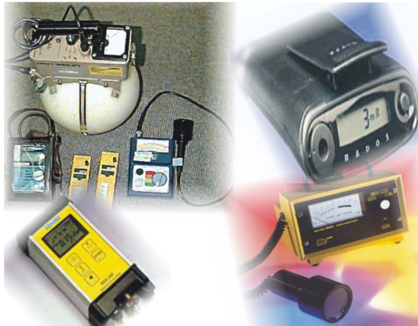
Gambar 2. Alat-alat ukur radiasi.

Mengingat adanya potensi bahaya radiasi/kontaminasi pada pemanfaatan zat radioaktif dan/atau sumber radiasi lainnya maka setiap personel yang bekerja di lingkungan ini harus memiliki pengetahuan dan ketrampilan dalam menangani bahaya radiasi pengion. Oleh karena itu setiap personel yang berkecimpung di bidang pemanfaatan zat radioaktif dan/sumber radiasi lainnya terlebih dahulu harus mengikuti pendidikan dan pelatihan tentang keselamatan dan kesehatan terhadap radiasi. Ini merupakan komponen ketujuh. Bahkan untuk beberapa profesi di bidang pemanfaatan zat radioaktif dan/atau sumber radiasi harus memiliki Surat Izin Bekerja (SIB); misalnya profesi sebagai Petugas Proteksi Radiasi (PPR), Operator Radiografi (OR) dan Operator Irradiator/Akselerator. SIB ini diperoleh setelah lulus ujian SIB dan lulus mengikuti pendidikan dan pelatihan pada bidang profesi yang akan dimasuki. Lembaga/institusi yang dapat menyelenggarakan pendidikan dan