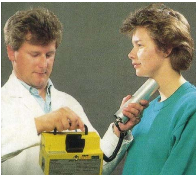
Gambar 2. Pemonitoran kelenjar tiroid untuk mengetahui kontaminasi interna oleh iod Radioaktif menggunakan detektor sinar gamma.

mengisi sel tiroid sehingga mencegah kelenjar tiroid menyerap iod radioaktif. KI juga bersifat melindungi jika diambil dalam waktu beberapa jam setelah paparan iod radioaktif. Masyarakat harus menelan satu dosis setiap hari hanya pada saat mereka terpapar iod radioaktif dan satu hari sesudahnya. Korban tidak perlu memakan makanan yang mengandung iod. KI harus digunakan hanya dengan petunjuk dokter atau penguasa kesehatan setempat. Hanya penguasa kesehatan setempat yang menentukan isotop radioaktif apa saja yang terlepas selama kecelakaan nuklir, dan jika iod radioaktif terlepas maka perlu menelan pil KI selama waktu tertentu. Setelah 3 bulan, perlu diperiksa kadar T3, T4, ETSA dan uji scanning tiroid. Untuk memastikan ada tidaknya pembentukan kanker, maka perlu dilakukan uji tiroglobulin.