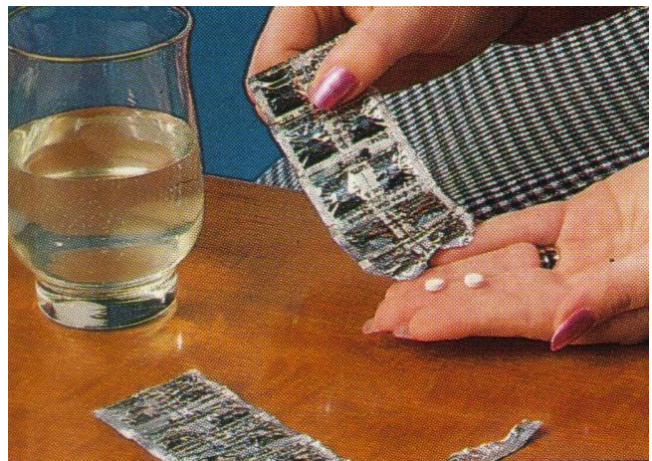
Gambar 3. Pil KI yang dikemas dan dapat dikonsumsi penduduk di sekitar area pengoperasian rutin pembangkit listrik tenaga nuklir dan saat terjadi kecelakaan.

Jutaan orang telah menelan pil KI tetapi hanya sedikit efek samping yang mereka rasakan. Hanya bagi mereka yang alergi terhadap reaksi iod yang dilarang menggunakannya. Orang berumur lebih dari 40 tahun tidak memerlukan KI kecuali terkena pajanan sangat tinggi oleh iod radioaktif. Jika KI diberikan dalam waktu cukup lama, maka akan menyebabkan hipotiroid temporer (kelenjar tiroid kurang aktif). Pemberian yang diperpanjang dapat menjadi masalah serius untuk anak-anak sehingga memerlukan petugas kesehatan yang professional. Pasien dengan Graves' hipertiroidism atau fungsi nodul tiroid harus juga diperiksa. Namun pada umumnya, 90% pasien kanker tiroid dapat bertahan hidup.