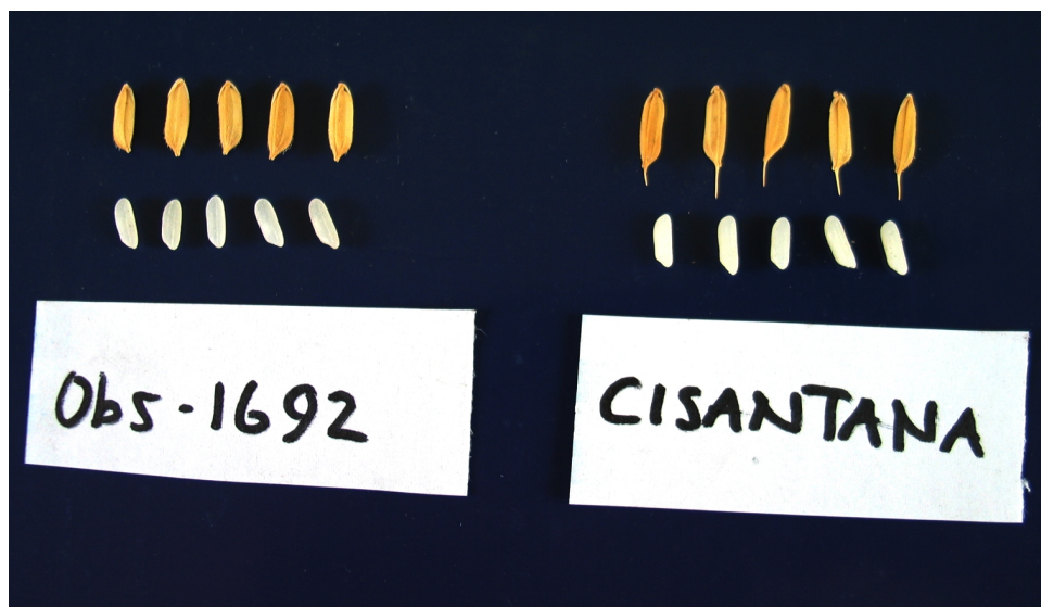
Gambar 4. Penampilan gabah dan beras galur mutan Obs-1692/PsJ