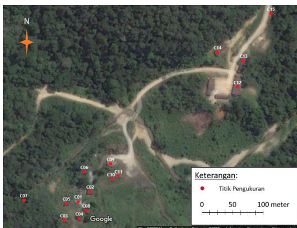
Gambar 3. Titik ukur di sekitar kamp pekerja.

Pengambilan data dilakukan dengan menggunakan alat ukur surveimeter radiasi gamma merk GammaScout yang telah dikalibrasi di Laboratorium Kalibrasi Pusat Teknologi Keselamatan dan Metrologi